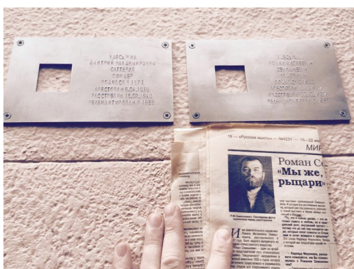
Вспольный переулок, 17