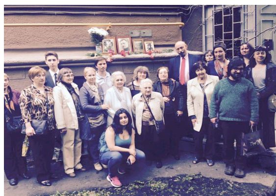
Новинский бульвар, 25 корпус 10